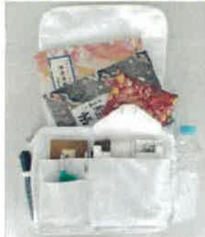
納経帳等・他 を入れた例

*商品に含まれる物 さんや袋、簡易ローソク・線香入れ付 (納経帳等・他 収納例の商品は別購入となります)