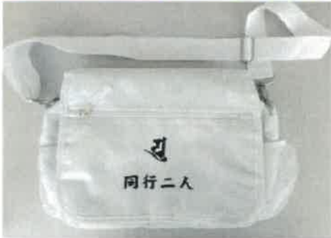
同行二人印字入り

お参りに欠かせない必需品(お参りに便利な簡易ローソク・線香入れ付・経本・数珠等)を入れる為の袋 肩から斜めに掛け持ち運びに便利です。