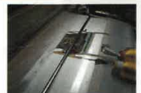
西陣織り製作途中イメージ